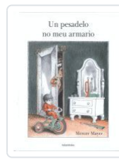
UN PESADELO NO MEU ARMARIO MAYER, MERCER