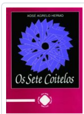
OS SETE COITELOS XOSE AGRELO HERMO