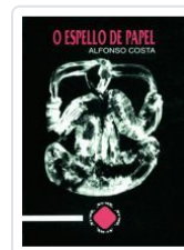
O ESPELLO DE PAPEL ALFONSO COSTA