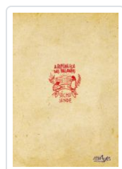
A REPUBLICA DAS PALAVRAS SECHU SENDE