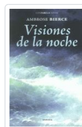
39.VISIONES DE LA NOCHE AMBROSE BIERCE