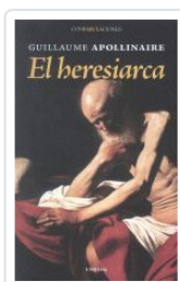
17.EL HERESIARCA GUILLAUME APOLLINAIRE