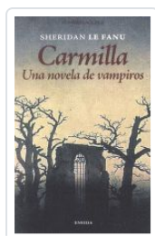
16.CARMILLA.UNA NOVELA DE VAMPIROS SHERIDAN LE FANU