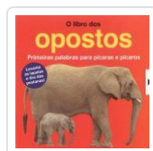
O LIBRO DOS OPOSTOS. PRIMEIRAS PALABRAS PARA PICARAS E PICA SARAH POWELL; BARBI SIDO