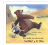
CATALINA Y EL OSO, SIN RUMBO POR EL MUNDO PIEPER, CHRISTIANE