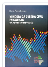
MEMORIA DA GUERRA CIVIL EN GALICIA MARIE-PIERRE BOSSAN