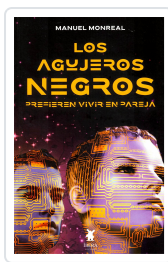
LOS AGUJEROS NEGROS PREFIEREN VIVIR EN PAREJA MANUEL MONREAL