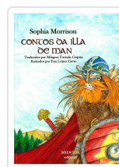
CONTOS DA ILLA DE MAN (TAPA DURA) SOPHIA MORRISON