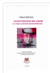
VINTE POEMAS DE AMOR E UNHA CANCIÓN DESESPERADA PABLO NERUDA