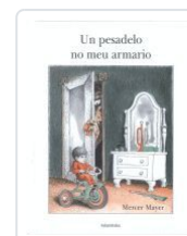
UN PESADELO NO MEU ARMARIO MAYER, MERCER