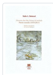
T.DURA.MEMORIA DOS DIAS, FORMAS DA LEVIDADE XULIO L.VALCARCEL