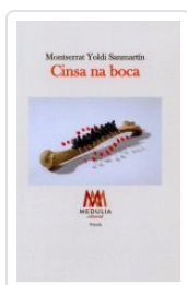
CINSA NA BOCA MONTSERRAT YOLDI SANMARTÍN