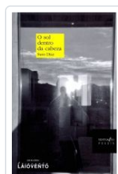
O SOL DENTRO DA CABEZA SUSO DIAZ