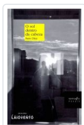
O SOL DENTRO DA CABEZA SUSO DIAZ