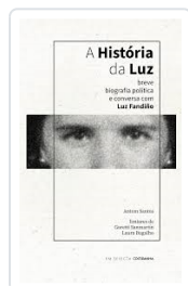
A HISTÓRIA DA LUZ ANTOM SANTOS