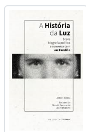
A HISTÓRIA DA LUZ ANTOM SANTOS