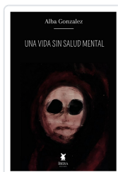
UNA VIDA SIN SALUD MENTAL ALBA GONZALEZ