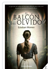
EL BALCÓN DEL OLVIDO ESTEBAN MONEO