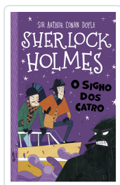
SHERLOCK HOLMES. O SIGNO DOS CATRO SIR ARTHUR CONAN COYLE; STEPHANIE BAUDET