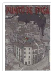
PUNTO DE FUGA MIGUEL CUBA