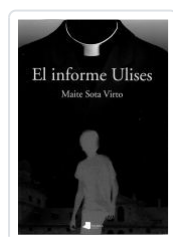
EL INFORME ULISES MAITE SOTA VIRTO