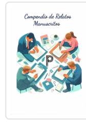
COMPENDIO DE RELATOS MANUSCRITOS VV.AA.