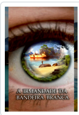
A IRMANDADE DA BANDEIRA BRANCA ANXO MUIÑOS