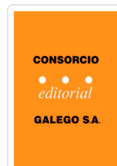
PUCHO, O HABITADOR DOS TELLADOS JANEIRO, MANUEL