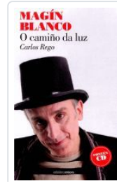
MAGÍN BLANCO. O CAMIÑO DA LUZ (CONTEN CD) CARLOS REGO