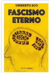
FASCISMO ETERNO UMBERTO ECO