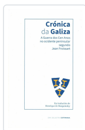
CRÓNICA DA GALIZA JEAN FROISSART