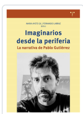
IMAGINARIOS DESDE LA PERIFERIA MARIA AYETE GIL; FERNANDO LARRAZ(EDS.)