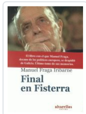
FINAL EN FISTERRA (TERCER Y ÚLTIMO TOMO DE MEMORIAS) FRAGA IRIBARNE, MANUEL