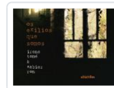
OS EXILIOS QUE SOMOS.VERSOS E IMAXES IRENE TOME; XABIER RON