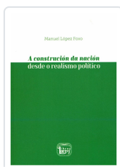
A CONSTRUCCIÓN DA NACIÓN DESDE O REALISMO POLÍTICO MANUEL LÓPEZ FOXO