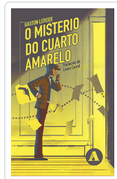
O MISTERIO DO CUARTO AMARELO LEROUX, GASTON