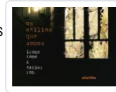
OS EXILIOS QUE SOMOS.VERSOS E IMAXES IRENE TOME; XABIER RON