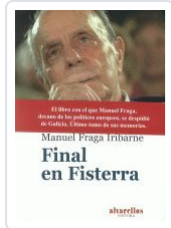
FINAL EN FISTERRA (TERCER Y ULTIMO TOMO DE MEMORIAS) FRAGA IRIBARNE, MANUEL