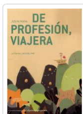
DE PROFESIÓN, VIAJERA JOSEFA PARRA