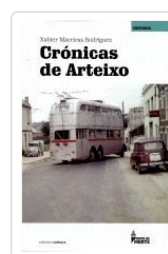
CRONICAS DE ARTEIXO XABIER MACEIRAS RODRIGUEZ