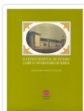
O ANTIGO HOSPITAL DE ESTEIRO CAMPUS UNIVERSITARIO DE FERROL JOSE RAMON SORALUCE BLOND