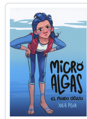
MICRO ALGAS. EL MUNDO OCULTO XULIA PISON