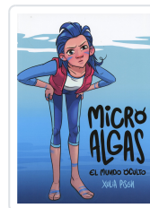
MICRO ALGAS. EL MUNDO OCULTO XULIA PISON