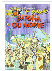
BAROÑA OU MORTE (OS BARBANZONS) PEPE CARREIRO