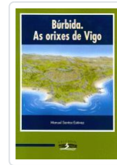
BURBIDA.AS ORIXES DE VIGO MANUEL SANTOS-ESTEVEZ