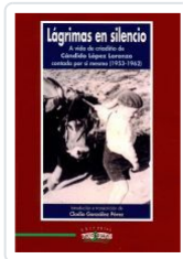
LAGRIMAS EN SILENCIO CANDIDO LOPEZ LORENZO