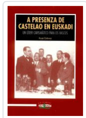
A PRESENZA DE CASTELAO EN EUSKADI XOSE ESTEVEZ