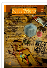
FOL DE VELENO Nº10. ANO 2021 AA.VV.