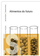
ALIMENTOS DO FUTURO JESÚS SIMAL GÁNDARA