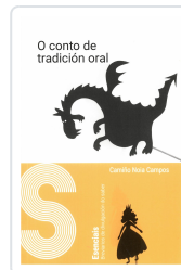
O CONTO DE TRADICIÓN ORAL CAMIÑO NOIA CAMPOS