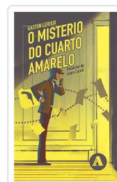
O MISTERIO DO CUARTO AMARELO LEROUX, GASTON