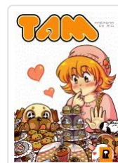
TAM ANEMONA DE RIO