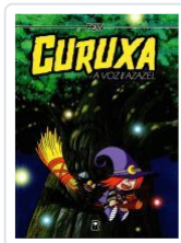
CURUXA.A VOZ DE AZAZEL. FONSO BARREIRO