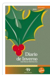
DIARIO DE INVIERNO MARTINEZ OCA, X.M.