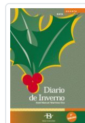
DIARIO DE INVERNO MARTINEZ OCA, X.M.