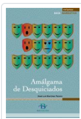
AMALGAMA DE DESQUICIADOS (RELATOS) MARTINEZ PEREIRO, X. L.