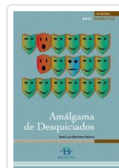
AMALGAMA DE DESQUICIADOS (RELATOS) MARTINEZ PEREIRO, X. L.