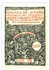
SONATA DE OTOÑO. MEMORIAS DEL MARQUES DE BRADOMIN RAMON DEL VALLE-INCLAN