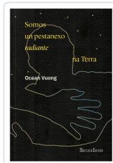
SOMOS UN PESTANEXO RADIANTE NA TERRA OCEAN VUONG