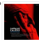
CARVALHO CALERO SEN FRONTEIRAS (INCLUE CD ) FOTOBIOGRAFIA AA.VV.