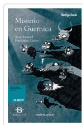
MISTERIO EN GUERNICA XOSE MANUEL FERNANDEZ CASTRO