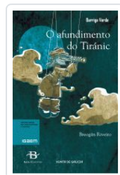
O AFUNDIMENTO DO TIRANIC BREOGAN RIVEIRO