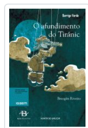
O AFUNDIMENTO DO TIRANIC BREOGAN RIVEIRO