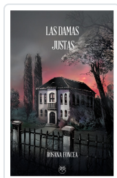
LAS DAMAS JUSTAS ROSANA FONCEA