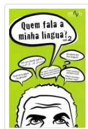
QUEM FALA A MINHA LINGUA? VOL.2 VV.AA.