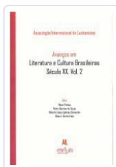
AVANÇOS EM LITERATURA E CULTURA BRASILEIRAS.SECULO XX.VOL.2 ASSOCIAÇÃO INTERNACIONAL DE LUSITANISTAS