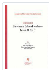
AVANÇOS EM LITERATURA E CULTURA BRASILEIRAS.SECULO XX.VOL.2 ASSOCIAÇÃO INTERNACIONAL DE LUSITANISTAS