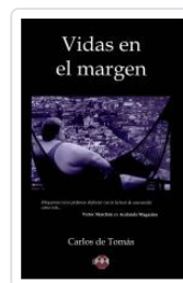
VIDAS EN EL MARGEN CARLOS DE TOMAS