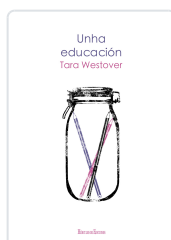
UNHA EDUCACION TARA WESTOVER