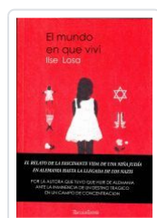
O MUNDO EN QUE VIVÍN ILSE LOSA