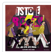
ISTO É ROCK! JAVIER BECERRA