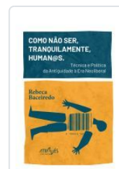
COMO NAO SER, TRANQUILAMENTE, HUMAN@S . TECNICA E POLITI REBECA BACEIREDO