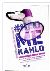
# NAO ME KAHLO.FEMINISMO ALEM DAS REDES VV.AA.